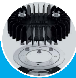
虹吸式屋面雨水排水系统