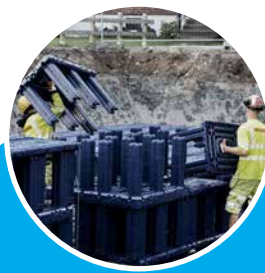
地下雨水调蓄 / 回用系统